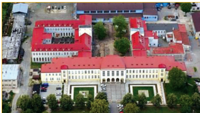
Pohľad na areál Štátneho ústavu pre zveľaďovanie živností

Podujatie financované z dotácie Ministerstva školstva, vedy, výskumu a športu Slovenskej republiky č. 0494/2019 na podporu výkonu kompetencií stavovských a profesijných organizácií.