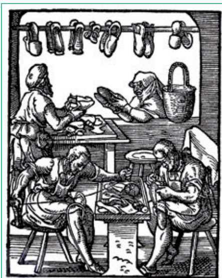
Stredoveká obuvnícka dielňa

niesli viac ako dve tretiny miestnych remeselníkov a obchodníkov. Podľa živnostenského zákona z roka 1924 sa všetky dovtedajšie živnostenské spolky museli transformovať na spoločenstvá, ktoré sa budovali na územnom princípe ako okresné a mestské zmiešané spoločenstvá alebo na odvetvom princípe ako odborné živnostenské spoločenstvá. Obchodnícke živnosti sa zároveň organizovali v obchodných grémiách. Do roku 1935 sa na Slovensku vytvorilo 81 zmiešaných živnostenských spoločenstiev a 19 odborných spoločenstiev, ktoré združovali celkom 99-tisíc členov a približne 50 obchodných grémií. Tam, kde spoločenstvá vznikli, boli pre všetkých miestnych živnostníkov povinné. Každý člen spoločenstva musel zaplatiť vstupný poplatok a pravidelné príspevky. Vlastné prostriedky týchto korporácií do-