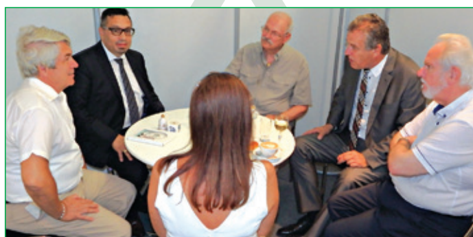
Vzácní hostia v stánku SŽK (AGROKOMPLEX 2018) aj bývalý prezident SR Ivan Gašparovič