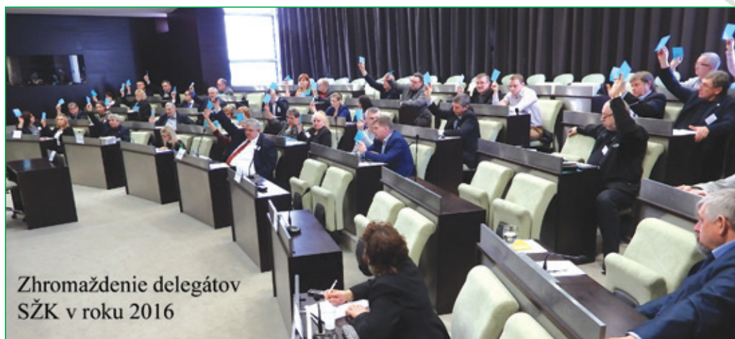
Zhromaždenie delegátov SŽK v roku 2016