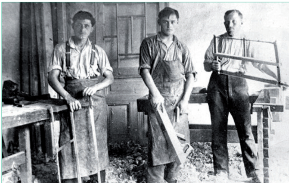
Stolársky majster a jeho tovariši. Pobedim (okr. Nové Mesto nad Váhom), 1926

Čoskoro po vzniku Československej republiky sa už 23. februára 1919 z iniciatívy martinských živnostníkov podarilo založiť organizáciu s celoslovenským pôsobením – Slovenskú remeselnícku jednotu. Zakladala miestne odbory, ktorých počet do roku 1923 vzrástol na 84 s celkovým počtom okolo 5 500 členov. Roku 1924 do