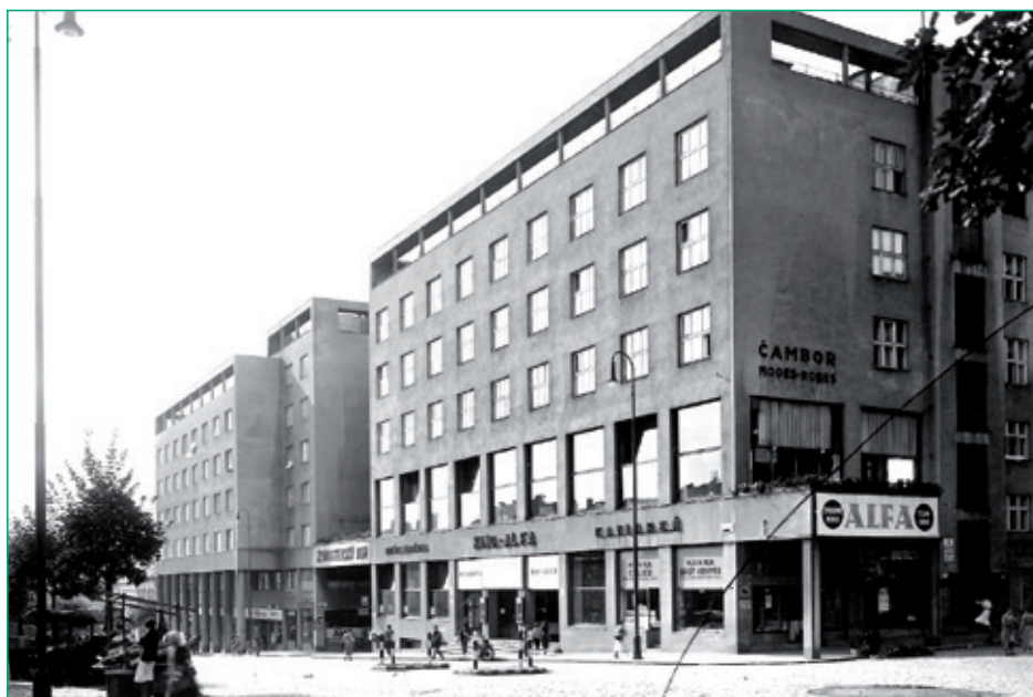
Živnodom na Kollárovom námestí pred dokončením v roku 1929