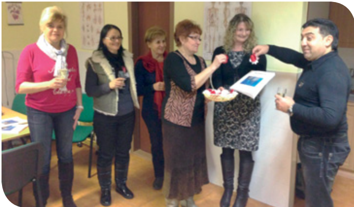
S kolegami v agentúre - krst knihy Pedikúra, ktorá vznikla na základe skvalitnenia výučby

V agentúre pôsobia ľudia z rôznych profesií, viacerí - členovia živnostenskej komory boli, ako zástupcovia Slovenskej živnostenskej komory, menovaní do skú-