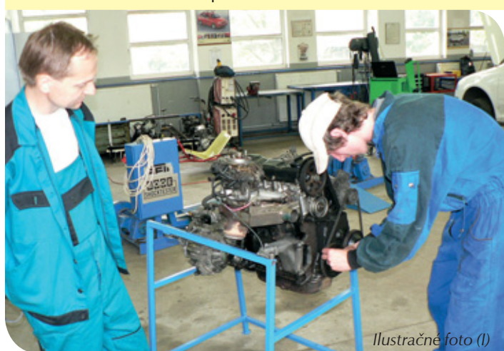
Ilustračné foto (I)

Celý projekt je financovaný z finančných prostriedkov Švajčiarskeho finančného mechanizmu prostredníctvom Národného kontaktného bodu, Úradu vlády Slovenskej republiky a to maximálne do výšky viac než tri a pol milióna eur v rámci Programu švajčiarsko-slovenskej spolupráce. Projekt sa bude realizovať do konca marca roku 2016 v oblastiach elektrotechnika, technická a aplikovaná chémia, potravinárstvo, stavebníctvo, geodézia a kartografia, ekonomika a organizácia, obchod a služby (kaderníci), technická chémia silikátov (služársky priemysel). V súčasnosti sa do projektu zapojilo desať stredných odborných škôl na Slovensku, z toho tri v Bratislave, dve v Prešove, ďalej v Šuranoch, Kežmarku, Leviciach, Novákoch a Lednických Rovniach. Do projektu je zapojených aj pätnásť zamestnávateľov, Zväz elektronického priemyslu, Štátny ústav na kontrolu liečiv a Cech pekárov a cukrárov. (tk)