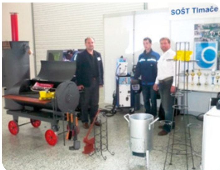
SOŠT Tlmače so záhradným grilom - oceneným ako TOP výrobok (jj)