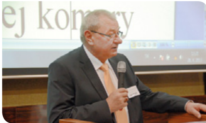
Predseda komory v správe hovoril o minulosti aj perspektívach komory