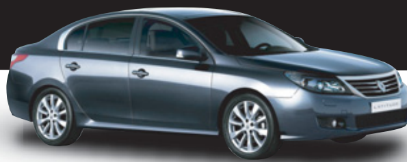
Renault Latitude Expression 2,0 dCi 110kW/150K