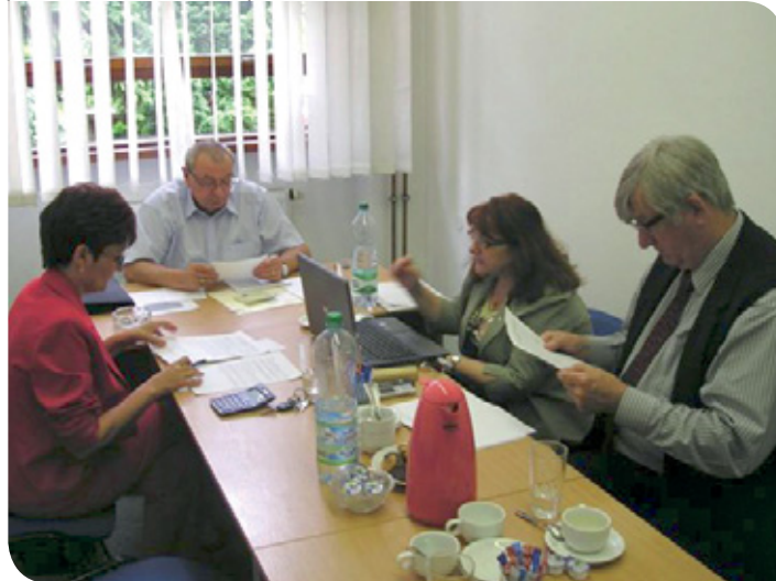
Zástupcovia SŽK a SŽZ na spoločnom sedení pred rokovaním na ministerstve práce

■ Doplňky na zmeny zákona. Slovenská živnostenská komora v rámci medirezortného pripomienkového konania k zákonu č. 568/2009 Z. z. predložila na Ministerstvo školstva SR pripomienky a doplnky k navrhovanej zmene. (m)