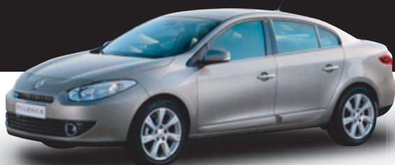
Renault Fluence Comfort 1,5 dCi 66kW/90k

Špeciálna ponuka pre Taxislužby: Veľmi výhodná cena automobilov s úspornými dieselovými motormi.