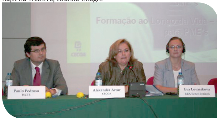
Zástupkyňa RRA Senec-Pezinok sa zúčastnila európskeho podujatia k programom únie v Lisabone.

Overenie teoretických vedomostí a praktických znalostí