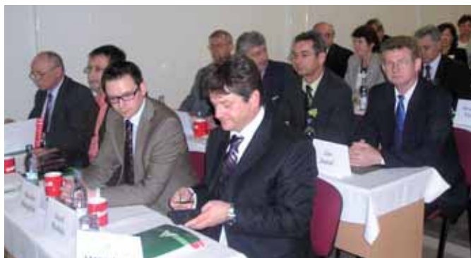
Fotografie zo zhromaždenia delegátov SZK