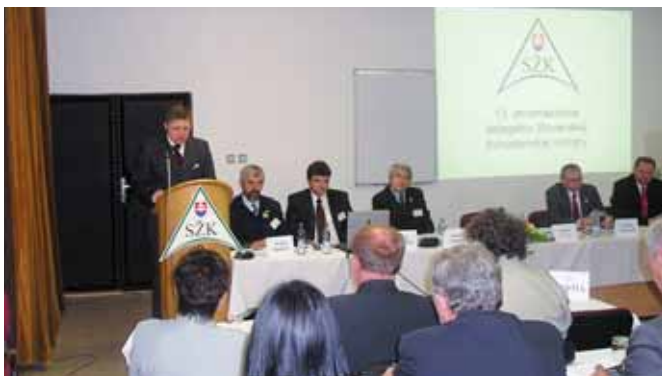
V úvode zhromaždenia sa delegátom prihovoral predseda vlády

A teraz do vlastnej kuchyne: Občas sa stane, že sa aj majster tesár utne. Aj keď by to nemalo byť ospravedlnením nekvalitnej práce. Stane sa však aj to, že nie každý je spokojný s prácou redaktora (to-bôž, keď je všetko v rukách jedinej (Pokračovanie na str. 2)