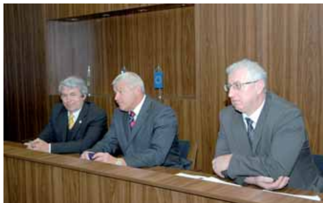
Fotografie z akcie trnavskej krajskej zložky (foto a)

partnerov. Malým a stredným podnikateľom môže pomôcť aj prezentácia na veľtrhoch, ktorých sa zúčastňuje samosprávny kraj. Išlo by o zviditeľnenie slovenského podnikateľa, ktorý tak dostane šancu dostať sa do povedomia väčšieho okruhu ľudí, čo by malo prispieť k po-