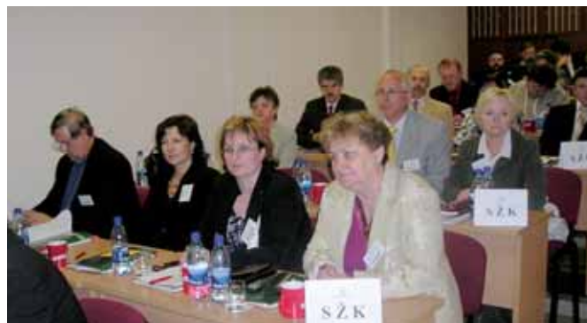
Delegáti zhromaždenia pri prejave predsedu vlády

Významná je vaša požiadavka, aby sme sa - pokiaľ ide o platiteľa DPH - vrátili k hranici vo výške 1,5 mil. Sk, keďže táto hranica bola v súvislosti s kurzom eura znížená na 1,05 mil. Sk, čo je problém predovšetkým pre malých živnostníkov, kde sa automaticky aj človek, ktorý má malý obrat, stáva platiteľom DPH. Tu sme sa dohodli a vláda spustila veľkú iniciatívu vo vzťahu k Európskej komisii a ona potvrdila výnimku z pravidla. Vrátili sme sa na hranicu 1,5 mil. Sk. Zástupcovia komory ďalej navrhovali, aby sme sa vrátili k inštitútu pau-