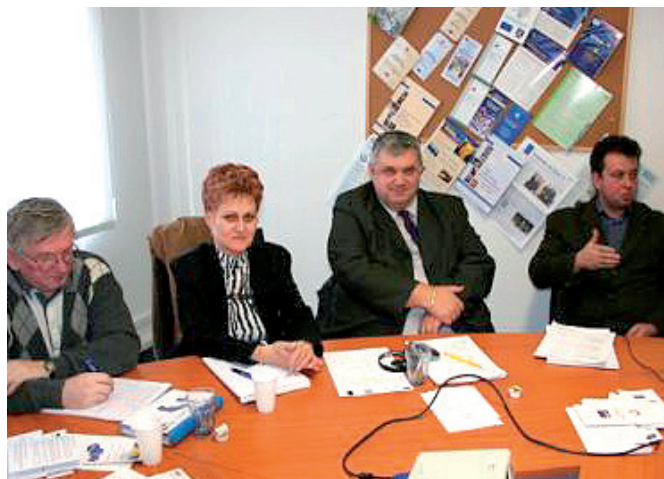
Účastníci marcového stretnutia.